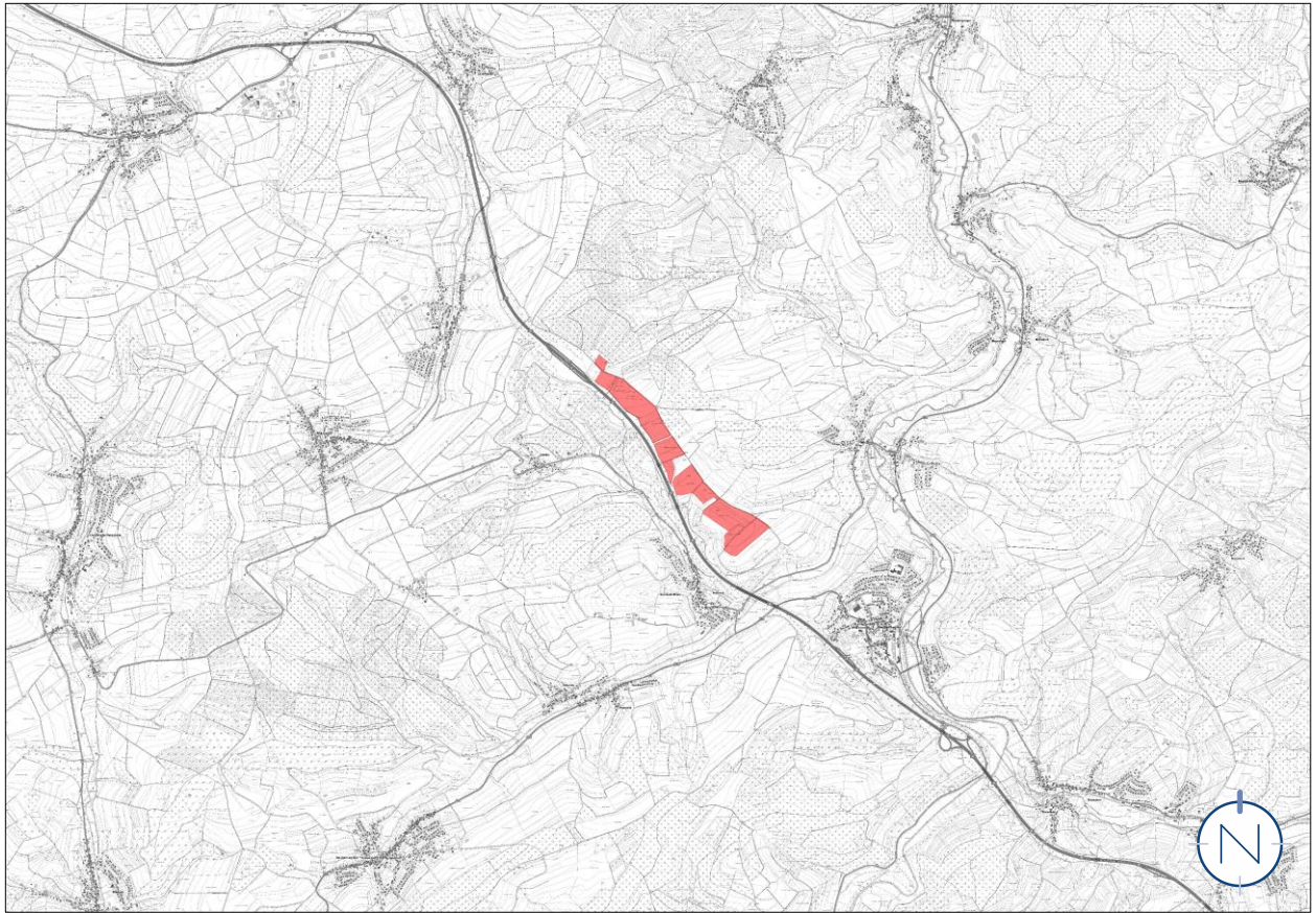
Stand: 11.12.2024