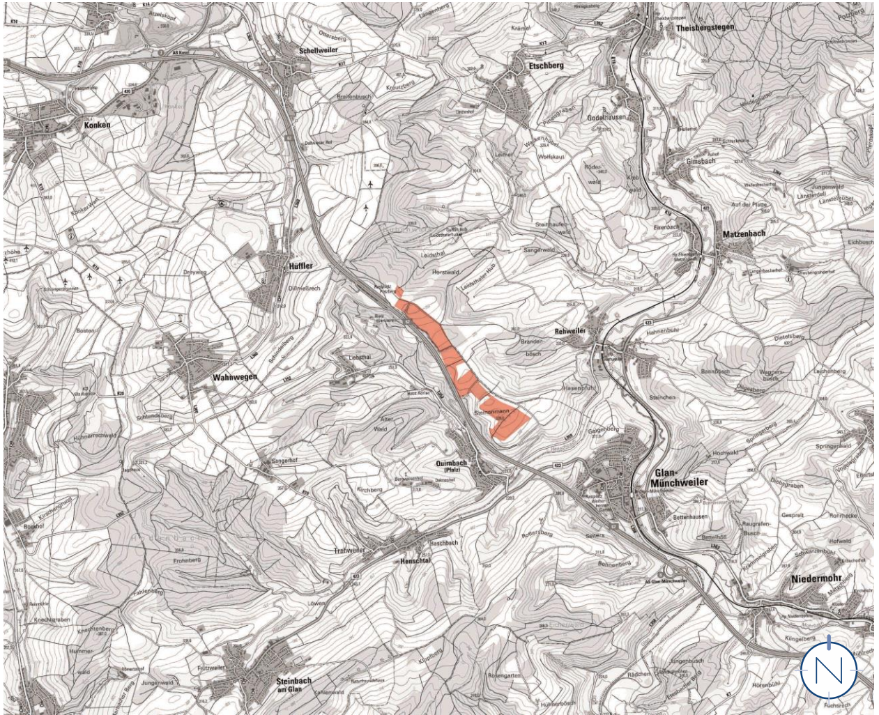
Bearbeitung: Kernplan; Stand: 01.08.2023