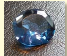
Der blaue Wittelsbacher

Kennen Sie die Bedeutung der vier C's bei der Diamantbewertung? Wenn nicht, wird es Zeit für einen Besuch im Diamantschleifermuseum Brücken.