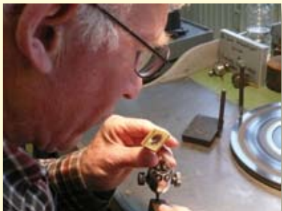
Diamantschleifer bei der Arbeit