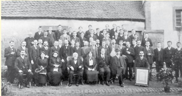
Jubiläumsbild der Schleiferei Triefuß auf der Neumühle 1898

Exponate, Bildtafeln und moderne Video- und Computerpräsentationen demonstrieren dem Besucher die wechselvolle Geschichte der Diamantschleiferei in Brücken und Umgebung.