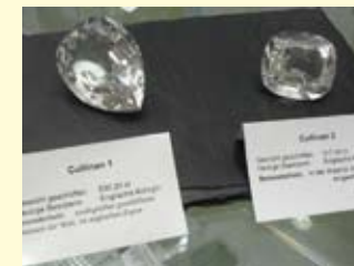
Cullinan 1 und Cullinan 2

Originalgetreue Nachbildungen der 35 größten und berühmtesten Diamanten sind ausgestellt und können bestaunt werden wie z.B.