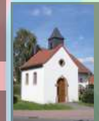
Kleine Kapelle Brücken (Pfalz)