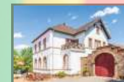
Bergmannsbauern-Museum Breitenbach (Pfalz)

Museen in der Verbandsgemeinde Oberes Glantal