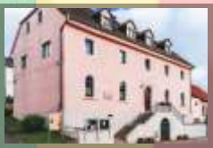
Kirschenlandmuseum Altenkirchen (Pfalz)