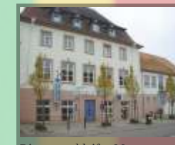
Diamantschleifer-Museum Brücken (Pfalz)