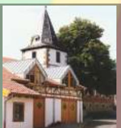
Jüd. Museum/Glockenturm Steinbach am Glan