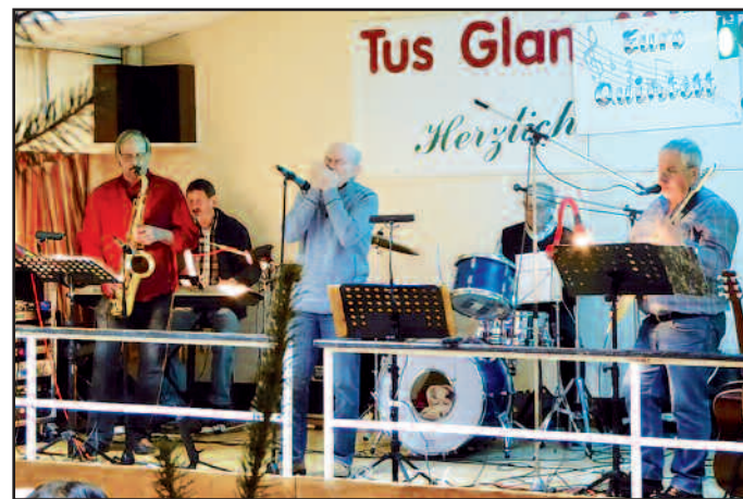
„Euroquintett und Freunde“ beim Adventskonzert am 17.12.2016 beim TUS Glan-Münchweiler