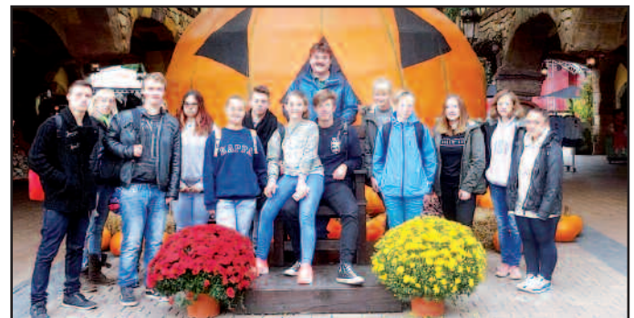
Viele verschiedene Tagesaktionen und Ausflüge. Hier ein Tag im Holiday Park

Begleitung als Mentor übernimmt der Jugendpfleger. Zum Ende des Jahres hin durfte natürlich die weihnachtlich geschmückte Hütte auf dem Waldmohrer Weihnachtsmarkt nicht fehlen und auch dort halfen einige Ehrenamtler und Besucher des Jugendhauses beim Crêpes backen und beim Verkauf selbst gebastelter Weihnachtsgeschenke. Ein so spannendes Jahr lässt einen froh zurückblicken und auch auf das Jahr 2017 können alle Jugendlichen ab 12 Jahren gespannt sein, denn die Jugendpflege lässt sich für Jugendliche und junge Erwachsene immer wieder etwas Spannendes und Interessantes einfallen. Das Team der Jugendpflege und des Jugendhauses sowie der gesamte Jugendrat des Jugendhauses wünschen Ihnen einen guten Start ins Jahr 2017!