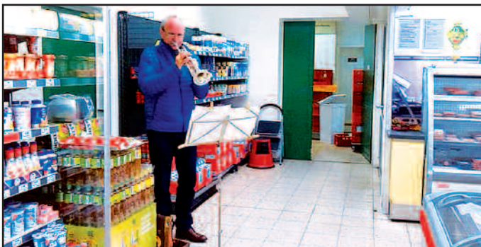
„Gutes aus der Region im CAP-Markt, Pfälzer Gemüse, Pfälzer Wurst und ein Brigger Wandermusikant!“