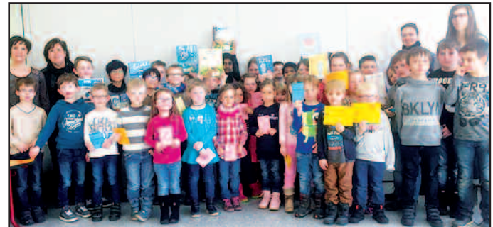
Vorschulkinder des Kindergarten St. Valentin mit ihren Erzieherinnen sowie die Lesescouts der Grundschule Schönenberg-Kübelberg mit den Leiterinnen

haben. Das Ziel der Lesescouts ist es, Lesefreude zu wecken und andere fürs Lesen und Vorlesen zu begeistern. Um dies bereits den Allerkleinsten zu vermitteln, wurden die Vorschulkinder des Kindergartens St. Valentin zu einem Lese-Café eingeladen, bei denen die Lesescouts den Kindergartenkindern bei Plätzchen und Saft einige Geschichten vorlasen. Anschließend wurde diese Vorleseaktion durch das gemeinsame Fertigen eines Zauberbuches für die Kindergartenkinder abgeschlossen. Wir hatten einen tollen Nachmittag mit viel Spaß und freuen uns schon jetzt auf weitere Vorleseaktionen mit den Kindergärten! Die Lesescouts der Grundschule Schönenberg-Kübelberg