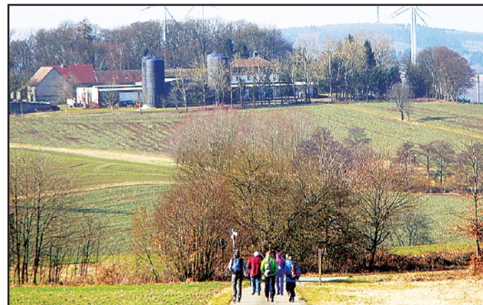
Die Wandergruppe des TuS. Im Hintergrund der Königsreicher Hof.

die Kraniche auf der Rückkehr aus dem Winterquartier zeigten sich als Vorbote des nahenden Frühlings. Zwischenziel der am DGH in Lan- genbach gestarteten Wanderung war das Wanderheim „Zur hohen Fels“ in Krottelbach. Nachdem ins- gesamt 280 Höhenmeter zurückge- legt waren, kehrte die Wandergrup- pe zum Ausgangsziel zurück.