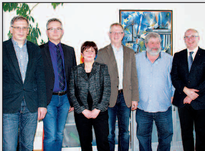
Das Bild zeigt die verabschiedeten Schiedspersonen mit den beiden Amtsgerichtsdirektoren