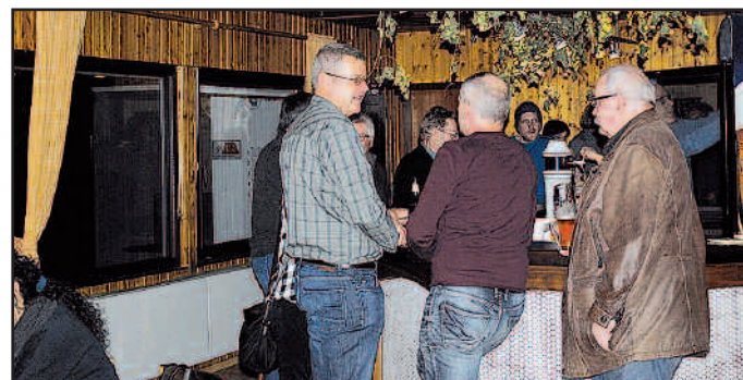
Ein Bierchen an der Bar