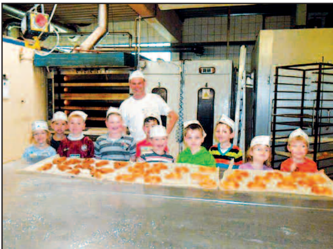
Wir sagen Danke für den schönen und interessanten Tag. Die Kinder und Erzieherinnen des Gemeindekindergartens I

Danach wurden wir noch mit Brezeln, Sprudel und einem tollen Abschiedsgeschenk überrascht. Einen Rucksack- in den haben wir unsere Backwerke getan und machten uns dann auf den Weg zum Kindergarten.