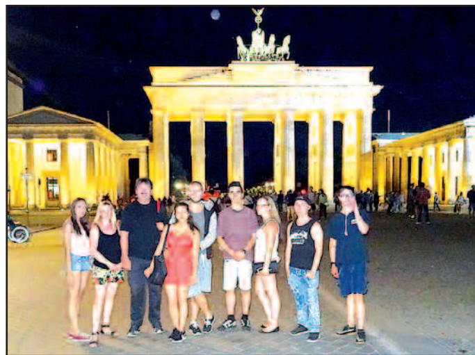
Ein Teil der Reisegruppe auf dem Pariser Platz zwischen Brandenburger Tor und Hotel Adlon.

Die Anmeldungen sind auch als Download auf unserer Internetseite juz-waldmohr.de erhältlich.