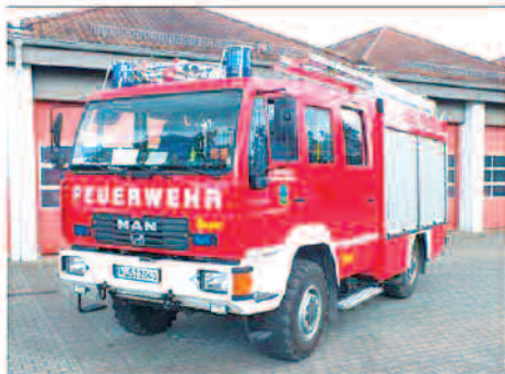
Veranstalter: Förderkreis der Freiwilligen Feuerwehr Altenkirchen

Kaffee und Kuchen von den Landfrauen Altenkirchen