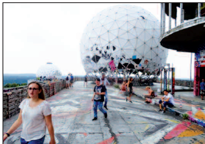
Die „Field Station Berlin“ auf dem Teufelsberg mit einer Kunstgalerie von hochwertigen Graffitis ist mit ihren Kupplern fast überall in Berlin gut zu erkennen.