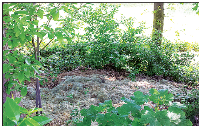
Feldstraße in Richtung Bruchwiesen