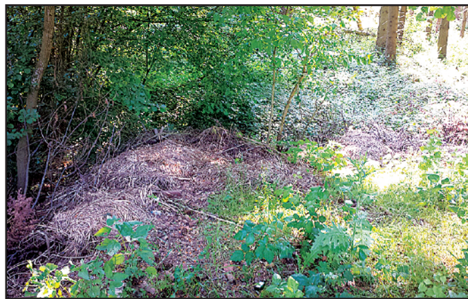
Am Parkplatz Motschweiher

Sprechstunde: Donnerstags von 17.00 bis 18.00 Uhr