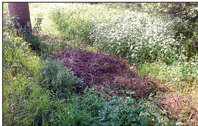
Weierstraße in Richtung Dörrberg