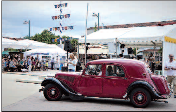
Rund 50 Fahrzeuge waren gekommen, dabei auch mehrere Waldmohrer Oldtimerfreunde.

stein Music Diplomacy. Am Sonntag stand die Oldtimerausstellung mit Präsentation und Rundfahrt durch den Ort auf dem Programm.