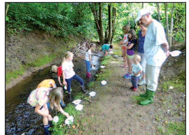
Ferienprogramm 2016 an der Henschbach