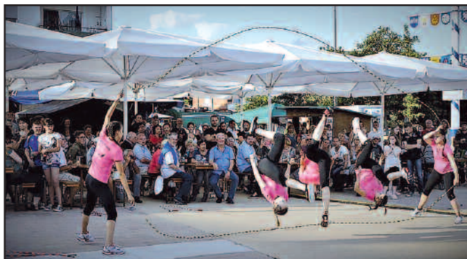
Die Rope Skipper zeigten, was sie in Berlin auf dem Deutschen Turnfest für Waldmohr vorgeführt haben. Im wahrsten Sinne des Wortes stellten sich die Waldmohrer für das Fest auf den Kopf.

Auch sportlich boten die Waldmohrer einiges, die Kinder der Tanzsportabteilung des TV Waldmohr führten ihre Tänze vor. Eine große Hüpfburg und ein 11 m langer Tunnel boten den Kleinen viel Spaß, hier hätten noch Kinder dabei sein können. Das Jugendhaus und der Bauhof waren hier engagiert. Der Angelsportverein bot ein Angelspiel an.