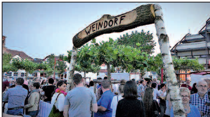
Der Feuerwehrförderverein errichtete unter den Planten ein Weindorf. Schönes Wetter, gute Musik und das Ambiente sorgten für beste Stimmung.

Für Speis und Trank sorgten die Vereine. Bis an die Grenzen der Möglichkeiten engagierten sich die Vereinsmitglieder.