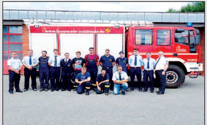
Abschluss am 25.06.2017 in Waldmohr

Wir wünschen allen Teilnehmern viel Erfolg bei ihren neuen Aufgaben.