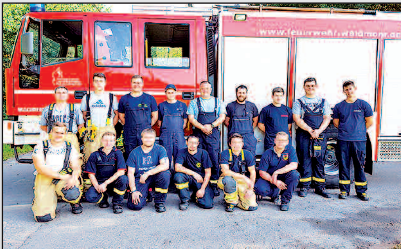
Samstag, 24.06.2017 Wasserförderung lange Wegstrecke, Sportplatz Sand

Der Unterricht wurde in einen theoretischen und einen praktischen Teil untergliedert.