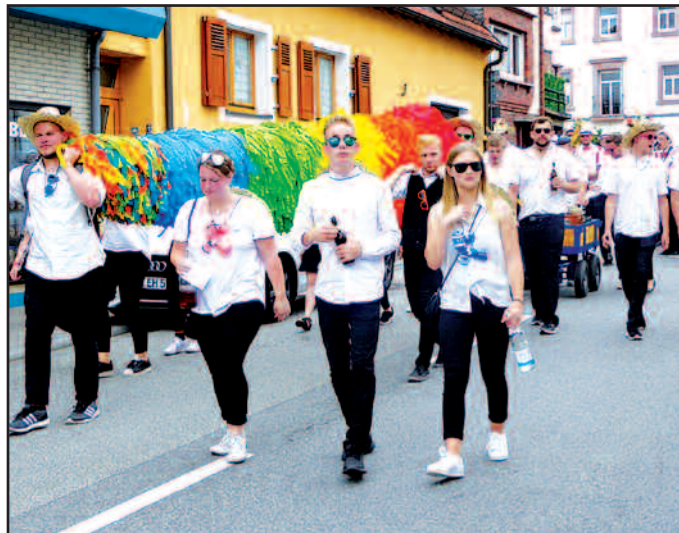
Kerweumzug am 09.07.2017