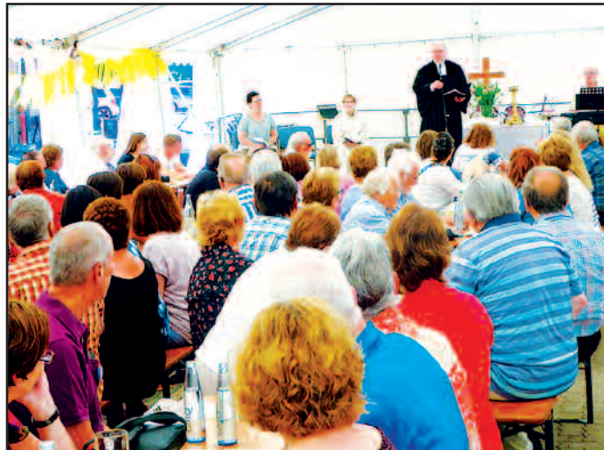
Kerwegottesdienst am 09.07.2017