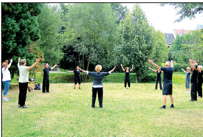
Qigongübungen im Freien

Die Termine: Jeweils am Montag, 14., 21. und 28. August. Zeit: 19.30 bis 21.30 Uhr; Ort: Schönenberg-Kübelberg (Sand). Treffpunkt bei der Kirche. Es ist keine Anmeldung erforderlich.