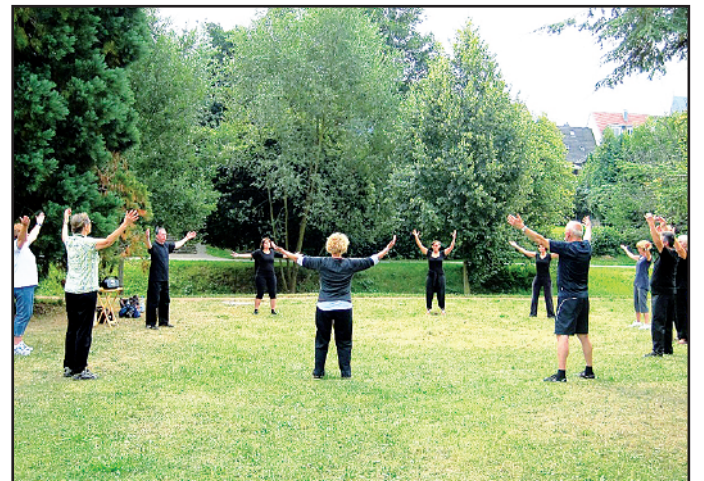
Qigongübungen im Freien