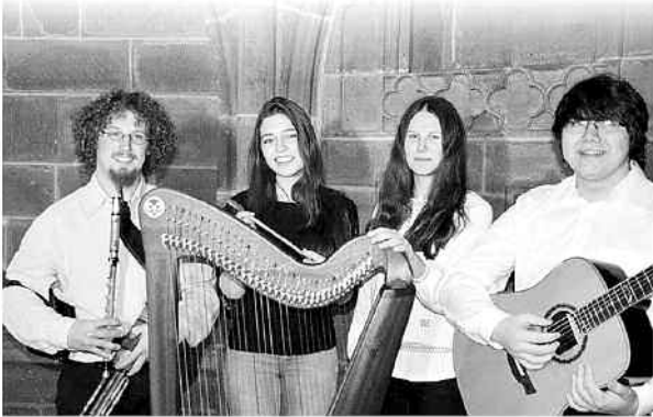
Leitung: Walter Lelle

Erleben Sie einen Abend mit authentischer irischer Musik, gespielt auf traditionellen Instrumenten.