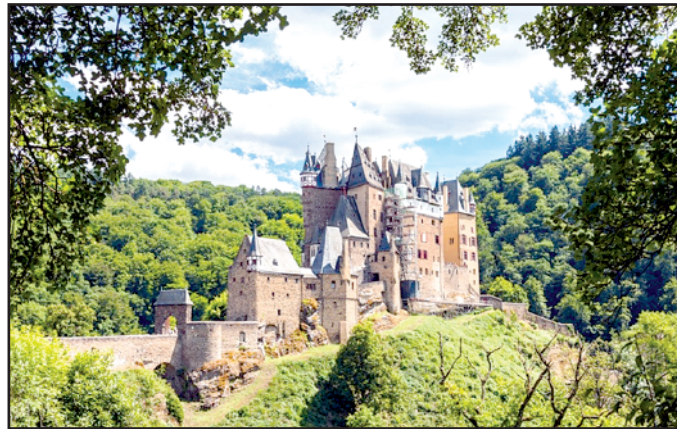
Burg Eltz - eines unserer Wanderziele abgeschieden inmitten des Waldes. Eine der schönsten Burgen Deutschlands.

Aus organisatorischen Gründen ist eine Anmeldung erforderlich. Bitte denkt auch an die geeignete Kleidung sowie an den eigenen Tagesproviant. Anmeldungen bitte an den Jugendpfleger unter der Nummer 0151/15381986 oder kommt einfach vorbei im Haus der Jugend Waldmohr.