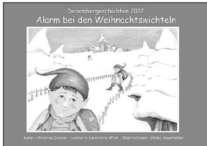
Autor: Christian Dreller - Lektorin: Henriette Wich - Illustrationen: Ulrike Sauerhöfer