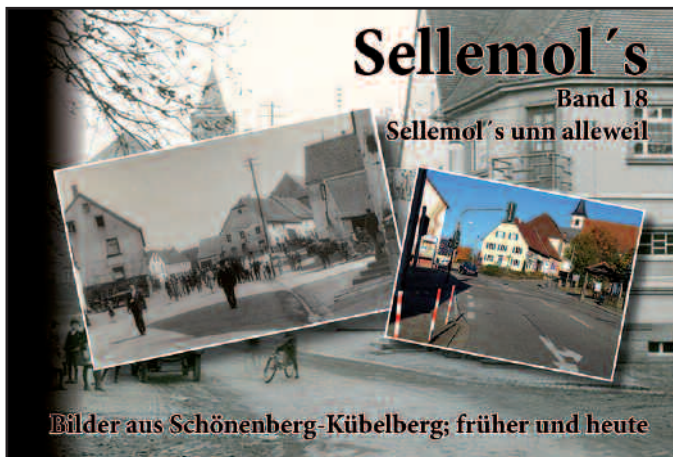
Bilder aus Schönenberg-Kübelberg; früher und heute

Neben den Verkaufsstellen haben durch ihre Inserate die Herausgabe unterstützt: Ranker Logistic GmbH, Eckhardt GmbH Garten- und Landschaftsbau, Schreinerei & Bestattungs-Institut Jung GmbH, Elektro Reinhard, Shell-Tankstelle Buser.