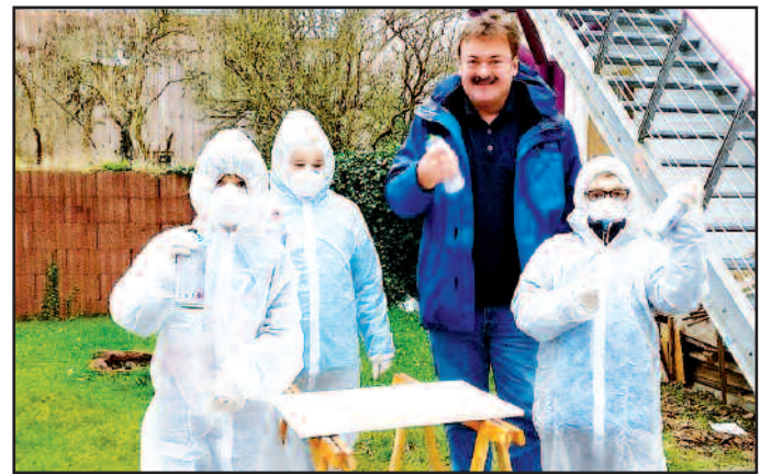
Unser wöchentliches Kreativangebot. Hier: Graffiti im Garten des Jugendhauses.

Jeder ab der Klassenstufe 5 darf kommen. Die Nutzung des Hauses und viele Angebote sind selbstverständlich kostenlos. Bei Fragen wendet euch bitte an den Jugendpfleger der Verbandsgemeinde Oberes Glantal Christoph Koch (01631817771).