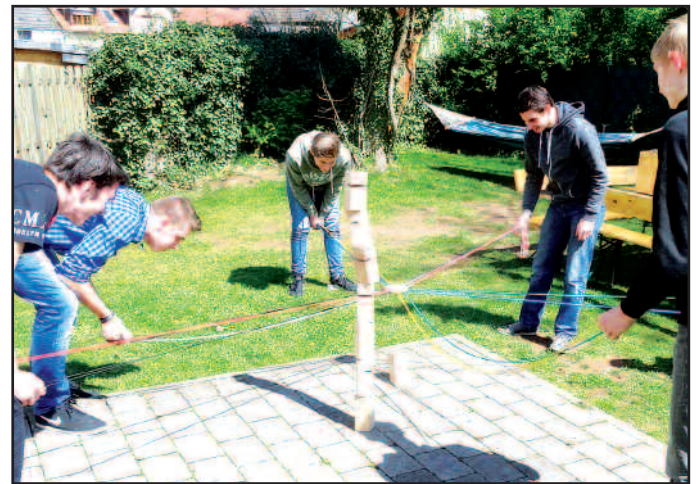
Beim Interaktionsspiel „Tower of Power“ im Garten des Jugendhauses stehen Teamgeist und Kommunikation im Vordergrund des Geschehens.

Unser Freizeitangebot mit Groß- und Interaktionsspielen. Hier mit Teilnehmern aus der Verbandsgemeinde im Garten des Jugendhauses.