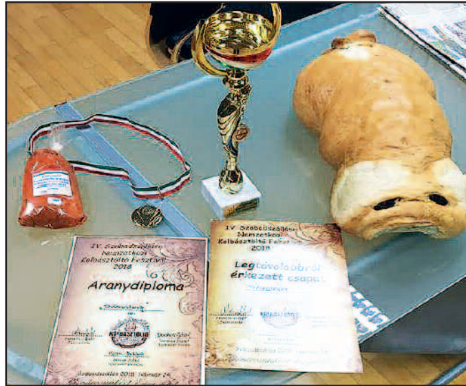
Unser Bild zeigt die Urkunden, den Pokal und das Glückschwein, das wir mit in die Pfalz genommen haben

Von einer unabhängigen Jury wurden Punkte auf Wurstkreationen verteilt, die lediglich mit einer Nummer gekennzeichnet waren. 50 Teams gaben ihre Wurst ab. Drei erhielten den ersten Preis - und wir waren dabei.