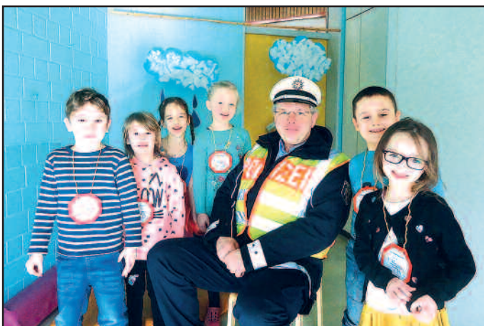
Die Bremer Stadtmusikanten.

Wir möchten uns auf diesem Weg nochmals für diese lehrreiche Unterstützung bedanken und freuen uns auf das nächste Mal!