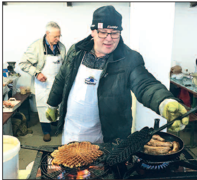
Mit den echten Grumbeer-Waffeln legten wir alle Ehre ein und hatten alle Hände voll zu tun, die Waffeln zu backen und zu verteilen