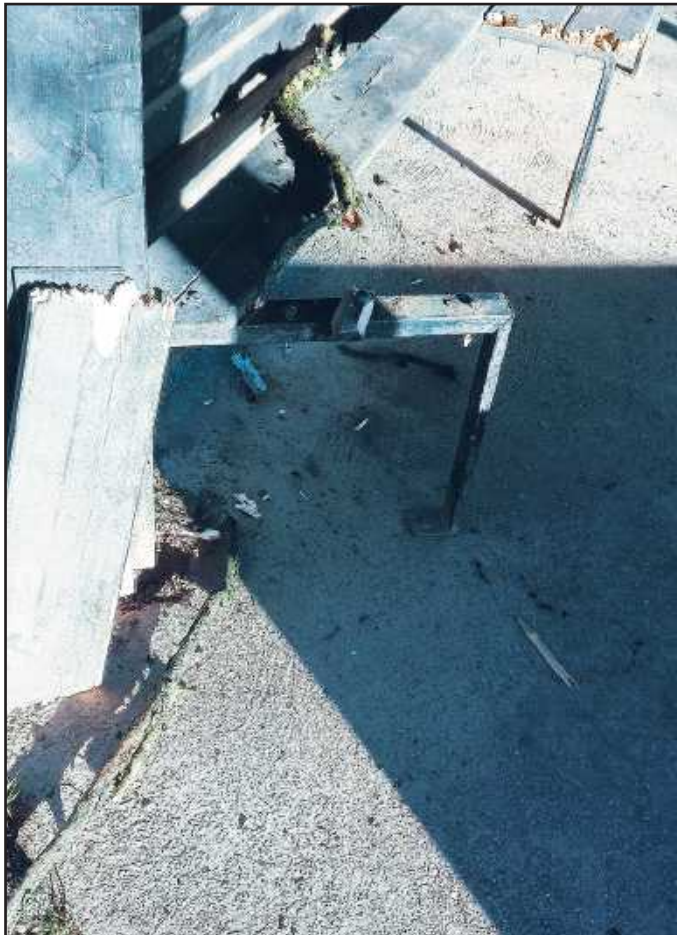
Beschädigungen des Pavillons auf der Sander Seeseite

Beschädigungen der neu aufgestellten Tische durch Einmalgrills, Beschädigungen des Pavillons auf der Sander Seeseite, ausgerissene und in den See geworfene Mülleimer. Dies sind die Ergebnisse einer blinden Zerstörungswut für die nun mit viel Zeit-, Geld- und Personalaufwand die Beseitigung der Schäden erfolgen muss.