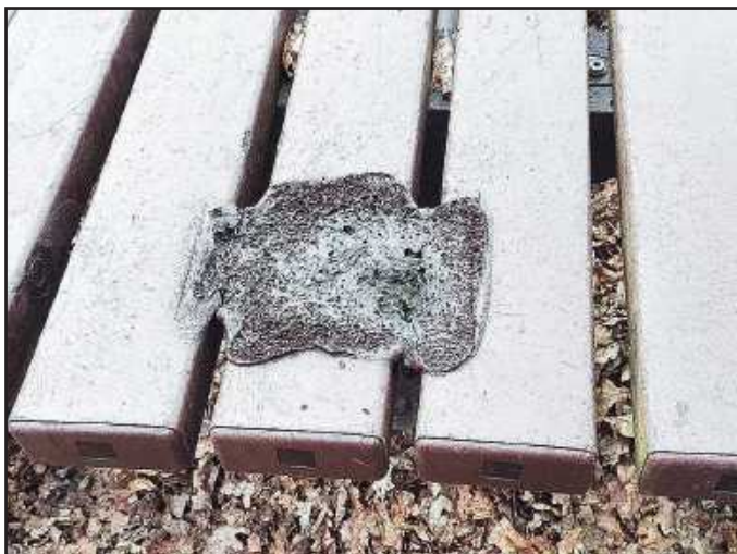
Beschädigungen der neu aufgestellten Tische durch Einmalgrills

Die Vandalen haben hier mit enormen Kraftaufwand erhebliche Schäden an den Freizeiteinrichtungen verursacht. Dies möchten wir nicht einfach so hinnehmen und haben Anzeige gegen Unbekannt erstattet.