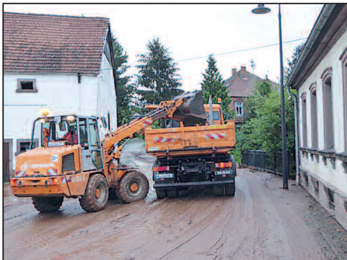
Die Mitarbeiter der Straßenmeisterei im Einsatz.