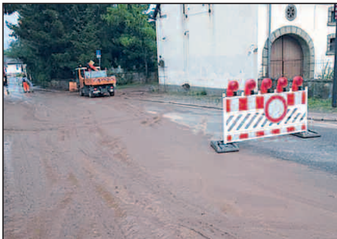
Mit dem Gemeindefahrzeug wird der Schlamm geschoben und die freiwillige Feuerwehr reinigt die Straße und die Bürgersteige mit Wasser.