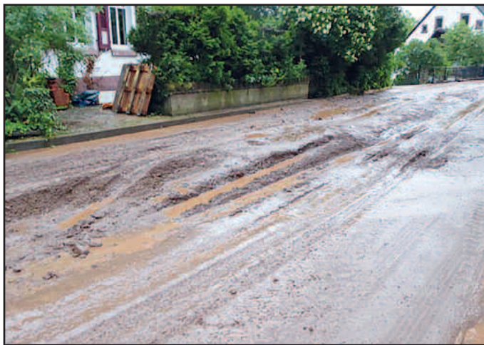
Die Landesstraße „Bettenhausen“ am Ortseingang aus Niedermohr her, am Morgen nach dem Unwetter.