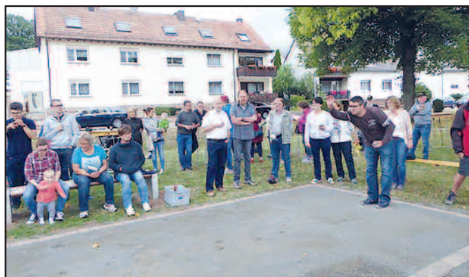
Großes Interesse und viel Spaß bei Spielern und Zuschauern