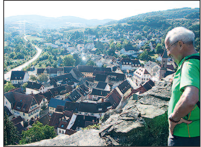
Blick von der Burgruine Neu-Wolfstein auf das unterhalb liegende Städtchen mit seiner historischen Altstadt.

Ankündigung: Einfache Wanderung auf heimatlichen Wegen am 30.9.2018. Nähere Informationen erfolgen rechtzeitig vor dem Termin auf dem üblichen Wege. Bitte vornehmen.