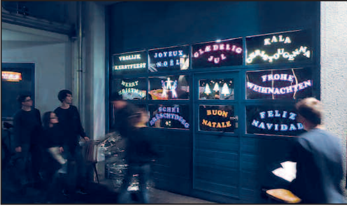
Adventsfenster der Jugendfeuerwehr 2016