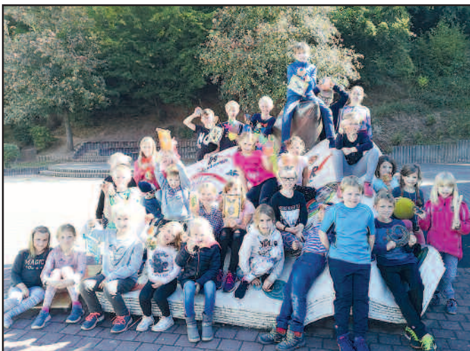
Ferienprogramm Standort Herschweiler-Pettersheim