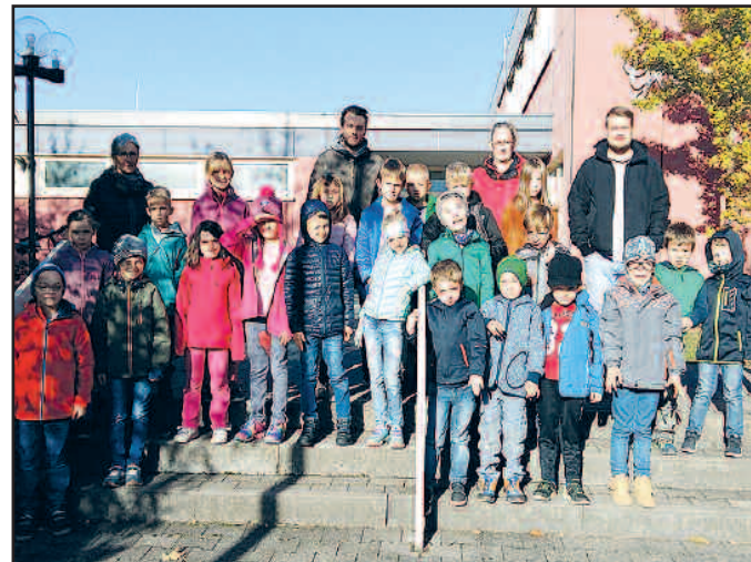
Ferienprogramm Standort Glan-Münchweiler