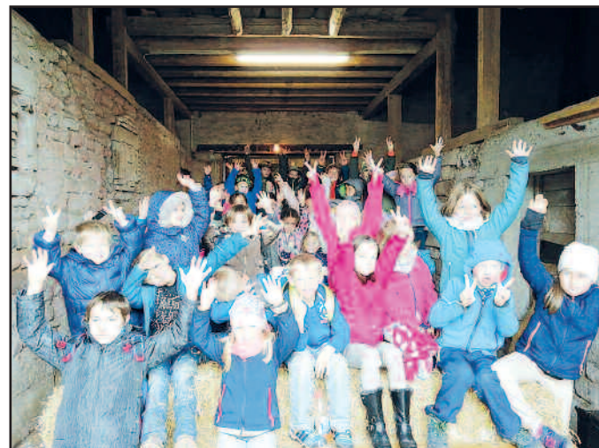
Ferienprogramm Standort Schönenberg-Kübelberg