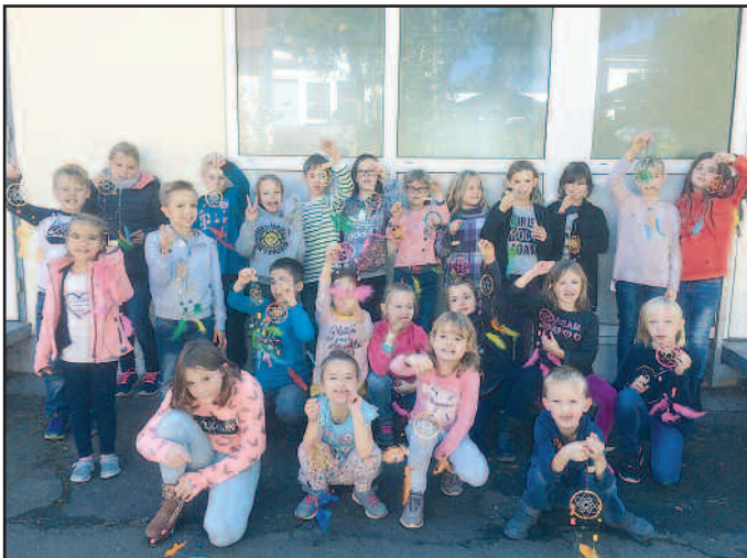
Ferienprogramm Standort Waldmohr