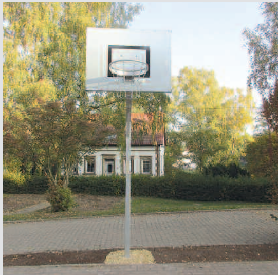
Basketballkorb GS Nanzdietsweiler

sich auf ca. 18.000 Euro. Die Arbeiten wurden in den Herbstferien von einem Unternehmen aus Rutsweiler ausgeführt. Die Schaffung von Bereichen mit unterschiedlichen Aufenthaltsqualitäten und Spielangeboten, hat den Schulhof der Grundschule in Nanzdietsweiler in erheblichem Maße für alle Schülerinnen und Schüler aufgewertet. Kreatives Spiel, Bewegung, Naturerlebnisse, sowie Entspannung und Erholung sind nun im neu gestalteten Schulhof möglich.