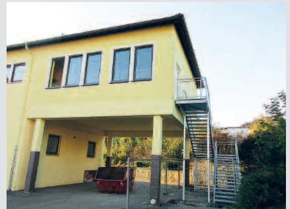
Fluchttreppe GS Altenkirchen