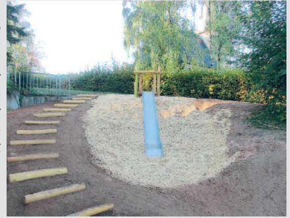
Hangrutsche GS Nanzdietsweiler