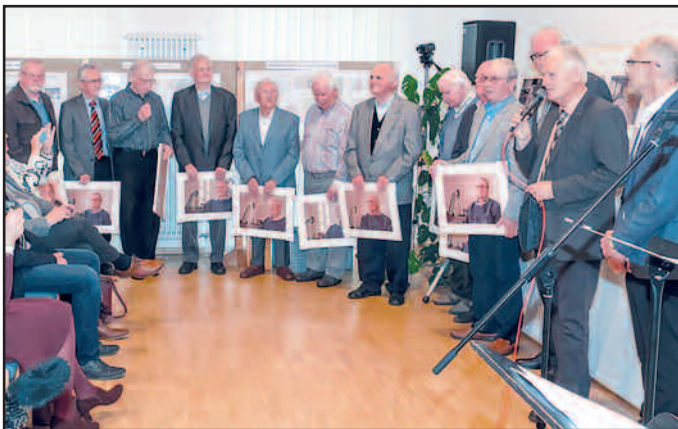
Ehrung der noch aktiven Diamantschleifer im Förderkreis