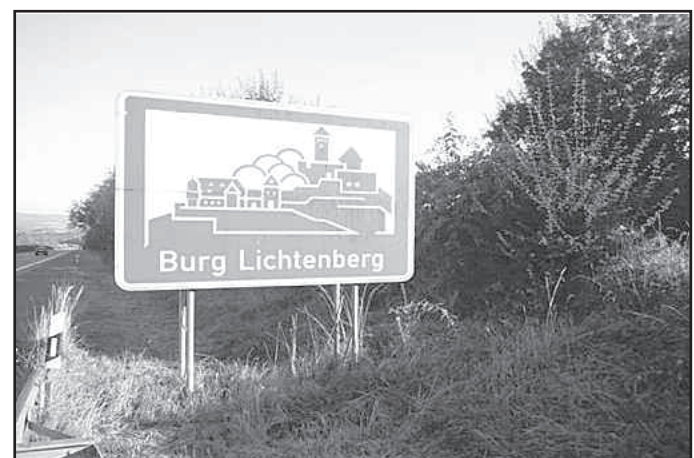
Alte Tafel (mittlerweile demontiert)