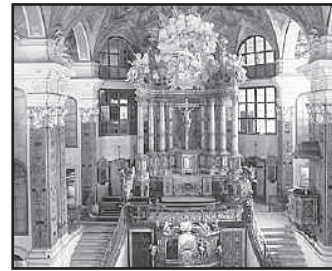
Schlosskirche Rastatt

Informationen zu weiteren Angeboten der KVHS finden Sie in unserem Programmheft oder auf unsere Homepage www.kvhs-kusel.de . Gerne informieren wir Sie auch telefonisch unter 06381/917530-10.