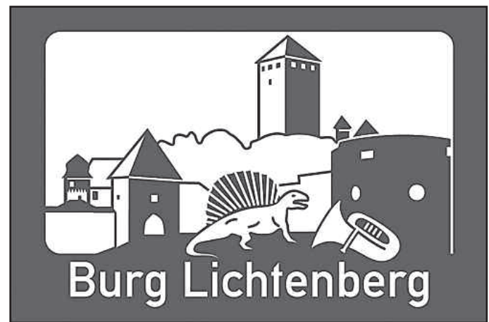
Abbildung neue Tafel

Die braun-weißen Tafeln weisen die Vorüberfahrenden auf touristisch interessante Ziele in der Nähe hin und bewegen mit Sicherheit den ein oder anderen zu einem kleinen Abstecher auf die Burg Lichtenberg.