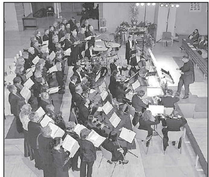
Auf dem Foto sind die Chöre ( ohne die Kids ) bei der Gala 2018 zu sehen.

Eine Dauerausstellung informiert über die Geschichte der Freiheitsbewegungen im 19. Jahrhundert und seit 2009 auch über Opposition und Widerstand in der DDR bis zur Friedlichen Revolution 1989.