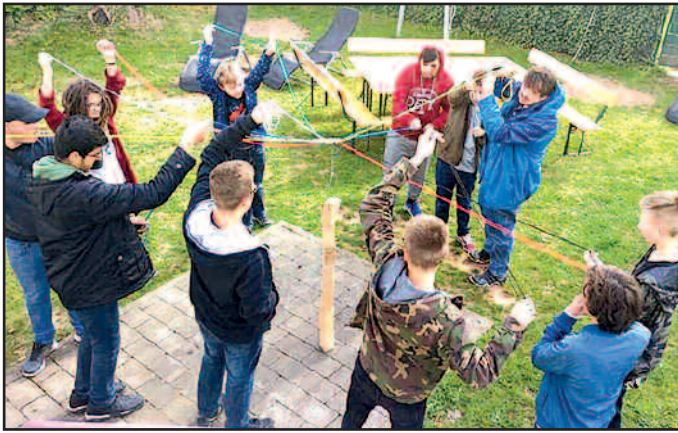
Jungen bei der Durchführung eines Teamspieles im Garten des Jugendhauses beim Jungenzukunftstag 2019

Am 28.03.2019 findet der bundesweite Jungen-Zukunftstag (Boys' Day) statt. Auch dieses Jahr unterstützt das Haus der Jugend diese bundesweite Initiative zur Berufsorientierung und Lebensplanung für Jungen. Beim Boys' Day handelt es sich um einen Aktionstag, an dem Jungen Berufe kennenlernen können, in denen größtenteils Frauen arbeiten. Dabei sind in diesen Berufsfeldern auch Männer gefragt wie nie zuvor. Grade im sozialen und pädagogischen Bereich sind die beruflichen Aussichten für die Jungen besonders gut. Zu diesen Berufsfeldern gehören beispielsweise Professionen wie Erzieher, Sozialpädagoge oder auch Grundschullehrer. Daher werden in diesem Seminar diese Berufe etwas ausführlicher vorgestellt. Außer-