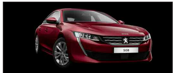
Markantes Design: Die Front des Peugeot 508 wird durch seine tiefgezogenen Scheinwerfer unverwechselbar

* Angaben gemäß den amtlichen Messverfahren.