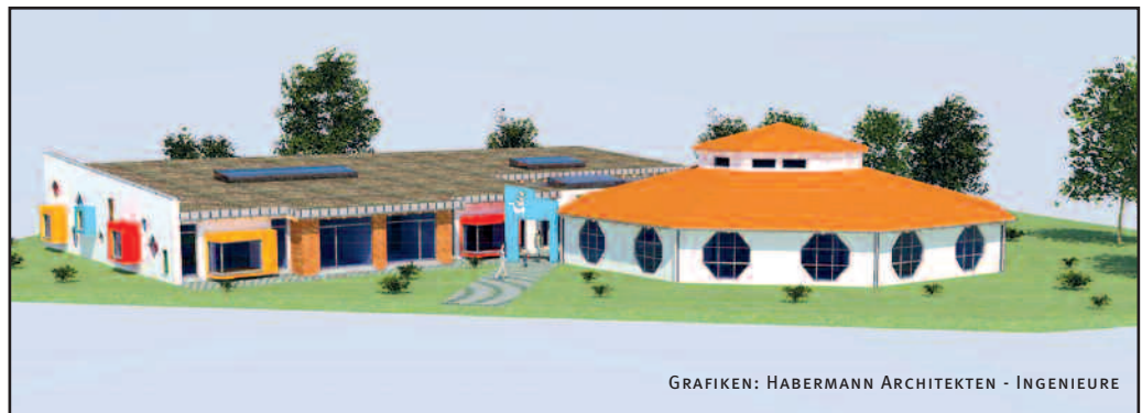
GRAFIKEN: HABERMANN ARCHITEKTEN - INGENIEURE

Ein Anbau an den Kindergarten 1 sieht jetzt drei neue Gruppenräume einschl. Nebenräume vor. Einer davon ist Ersatz für einen Gruppenraum im Altbau, der dem Übergang Alt auf Neu weichen musste.