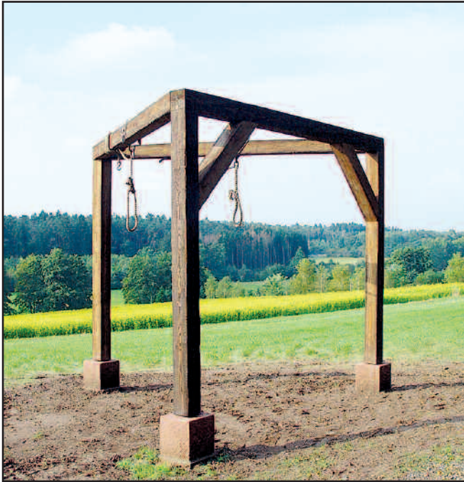
Galgen bei Sand

Weitere Informationen zum Ritter-Gerin-Weg erhalten Sie im Tourismusbüro der Verbandsgemeinde Oberes Glantal, Rathausstraße 8, Schönberg-Kübelberg, sowie in allen Bürgerbüros der Verbandsgemeindeverwaltung.