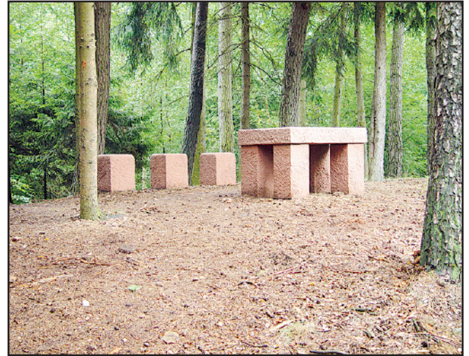
Rabentisch bei Schönberg