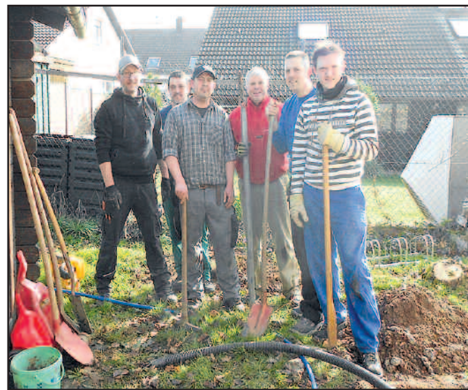
Im Bild die Freiwilligen

Schaufel ausgeführt werden. Nach Fertigstellung der Maßnahme gab es noch ein gemeinsames Essen. Die nächste Maßnahme wird das Anlegen des Matschplatzes sein. Dieser Einsatz wird noch rechtzeitig bekannt gegeben. Als Ortsbürgermeister bedanke ich mich bei den Helfern.