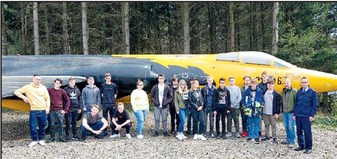
Die Schüler und Schülerinnen der WuT-Gruppe 9