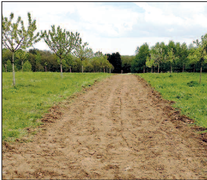
Die gut vorbereitete und ausgesäte Fläche am 23. April 2019

Weitere Informationen und Anmeldung unter www.gartenbauverein-waldmohr.de Mail: ogv-waldmohr@gmx.de oder Tel. 06373-209514