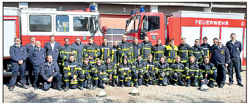
Die Teilnehmer*innen am Grundlehrgang 2019 mit Ausbilderteam, Wehrleiter und Kreisfeuerwehrinspektor