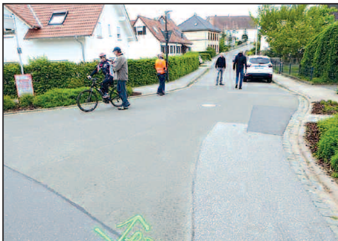
Die entsprechenden Straßenabschnitte sind bereits markiert: „DSK“