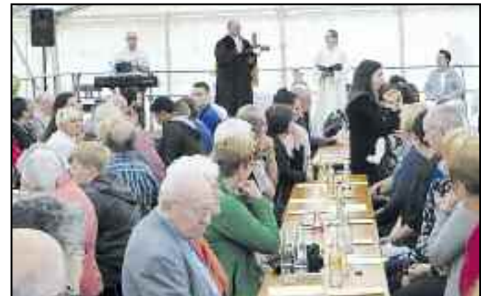
Kerwegottesdienst am 14.07.2019