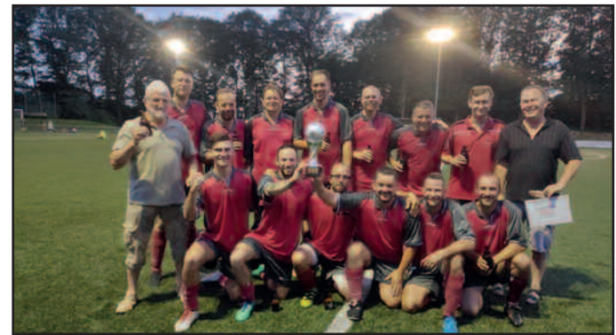
Siegermannschaft des TTC

Diese kam rechtzeitig zum Sportfest und erfreute sich schon großer Beliebtheit.