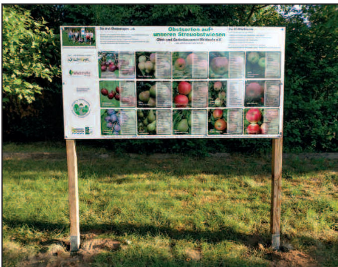
Infotafel auf der Obstwiese an der Rothenfeldsporthalle

formieren. Diese Tafeln wurden im Rahmen ein- es Leader-Projektes finanziert. Die Texte und die Fotos lieferten der be- kannten Obstexperte Hans-Joachim Banner.