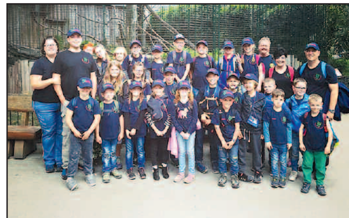
Bambinifeuerwehr aus Breitenbach, Dunzweiler und Waldmohr