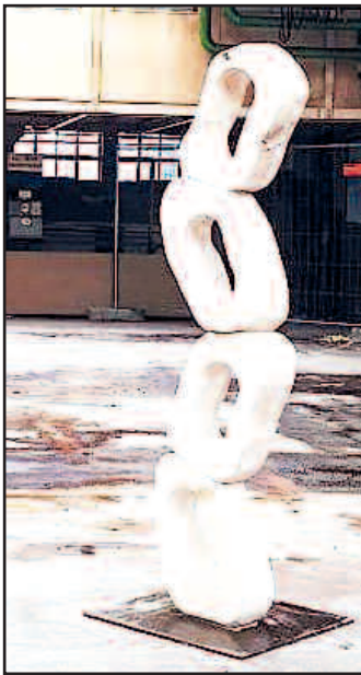
Unser Bild zeigt eine Skulptur von Lilau, wie sie ähnlich auch im Skulpturenpark rund um den Ohmbachsee zu finden ist.

Künstler aus Gries, dem Kunstkreis Kusel und aus der ungarischen Partnerstadt Szabadszállás kommen zusammen. Sie sind herzlich eingeladen zur Eröffnung am Freitag, 13. September um 18.30 Uhr im ehemaligen Schlecker-Markt (Glanstr. 8) in Brücken/Pfalz. Es singt zur Eröffnung der Chor Vocale und es schließt sich eine pfälzisch-ungarische Weinprobe mit Wein-König an.