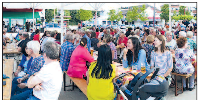
Dämmer-schoppen 3. August auf dem Marktplatz

dem Musikverein Limbach im Innenhof des Bürgerhauses. Die Konzerte wurden von der Karlsberg-Brauerei Homburg unterstützt.