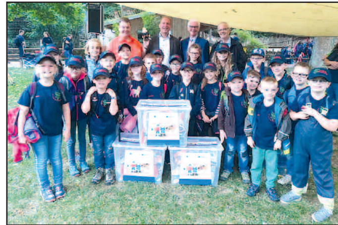
Jede Bambiniwehr bekam eine tolle Spielekiste geschenkt. Die können sehr gut gebrauchen!