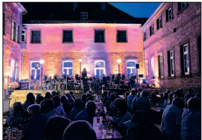
Dämmer-schoppen 24. August 2019 im Historischen Innenhof des Bürgerhauses