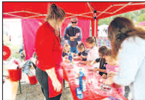
Basteln beim SPD-Ortsverein Waldmohr