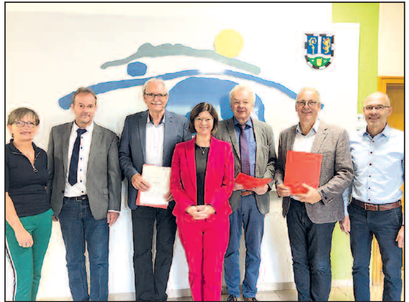
Bild der Übergabe