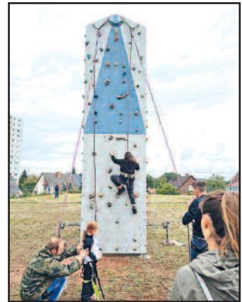
Der Kletterturm- der Gemeinschaftsstand