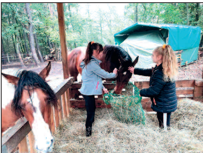
Teilnehmer der Ferienprogramms bei der Versorgung der Tiere

In einer kurzen Abschlussreflexion im Jugendhaus äußerten sich alle Teilnehmer positiv über die gemachten Erfahrungen. Trotz des Regens und der Arbeit hatten die Teilnehmer des Ferienprogramms viel Freude im Umgang mit den Tieren und erhielten wertvolle Impulse und Erkenntnisse.