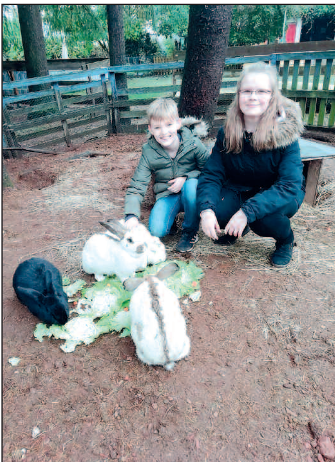
Beim Füttern der Riesenkaninchen