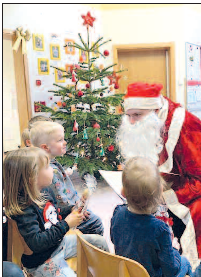
Ein toller Vormittag mit dem Nikolaus