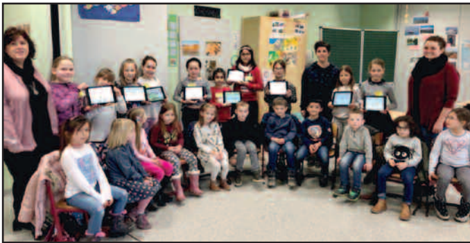
Kindergarten St. Valentin