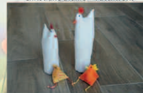
Christiane Blume - Patchwork