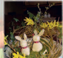
Hella Staudt - Häkelarbeiten