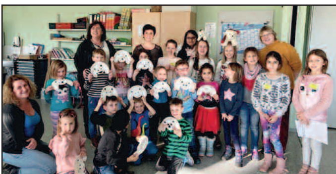
Kindergarten Kleine Strolche