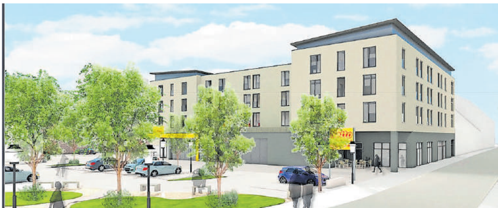
Die Visualisierung des Objektes, vom Rosengarten her

Abrissgenehmigung liegt vor - Baubeginn noch offen