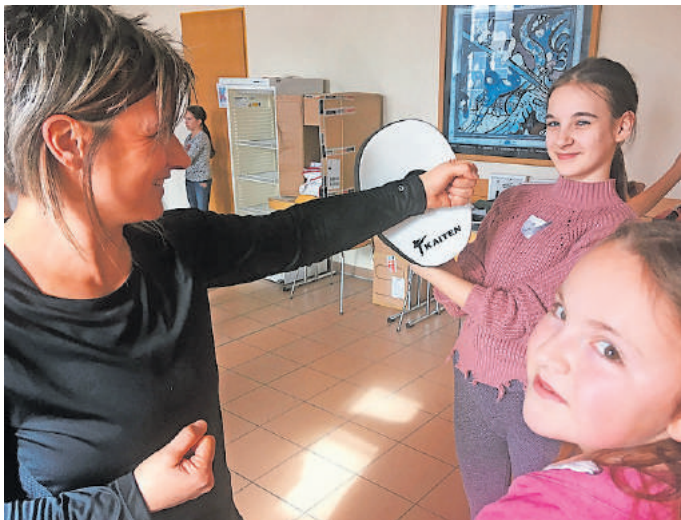
Der Spaß stand im Vordergrund