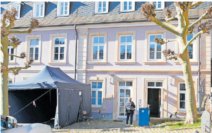
Kusel. Im Katharina-von-Bora-Haus ist derzeit die Corona-Praxis eingerichtet.

Zwei Praxen betreiben den Dienst während der Woche