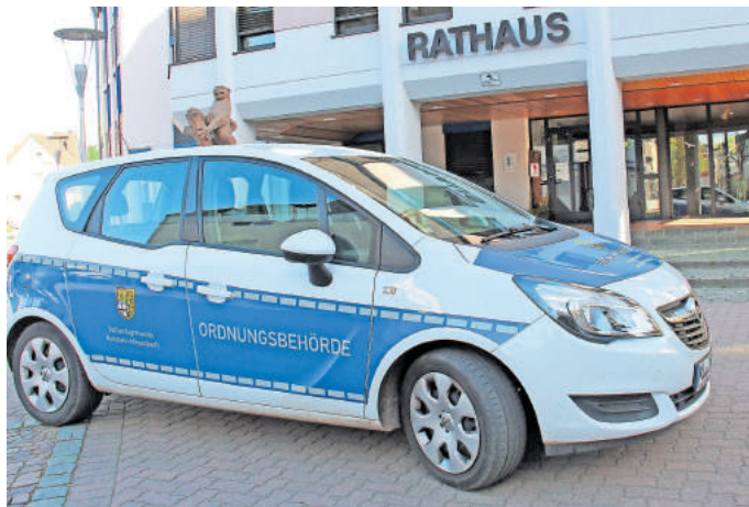
Das Ordnungsamt ist sieben Tage in der Woche im Einsatz