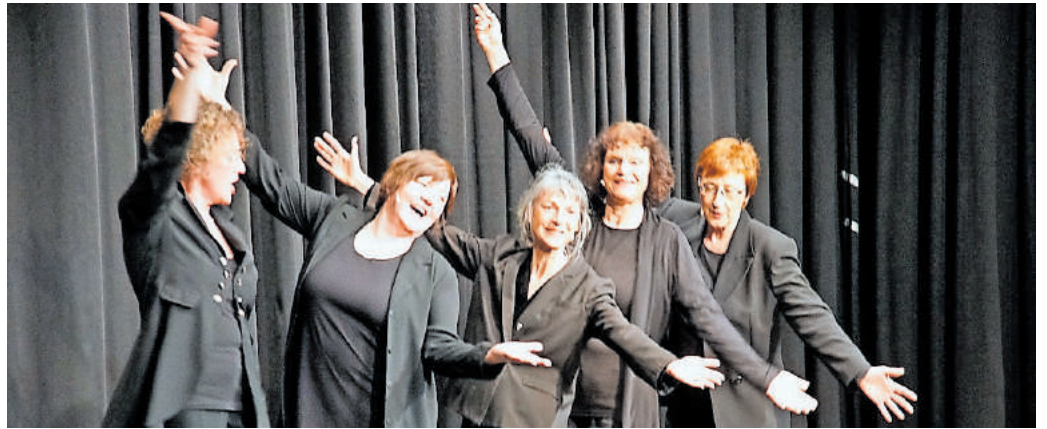
Die fünf Damen des Homburger Frauenkabarets sorgen für Lachsalven am laufenden Band

Endlich volljährig. Seit 18 Jahren spielt das Homburger Frauenkabarett in dieser Besetzung auf. Die Fünfmalklugen haben Themen aller Art aufgearbeitet, aufgebaut, aufgemöbelt, aufgezeigt, aufgesetzt, aufgelegt, aufgetischt – vom Großen und Ganzen bis zum kleinen Schwarzen