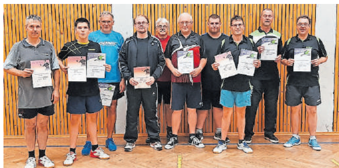
Die siegreichen Teilnehmer der Vereinsmeisterschaft