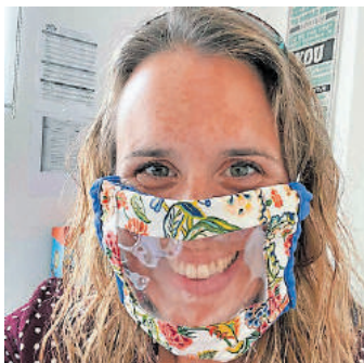
Das Team arbeitet mit spezielle Masken, die ein Fenster haben