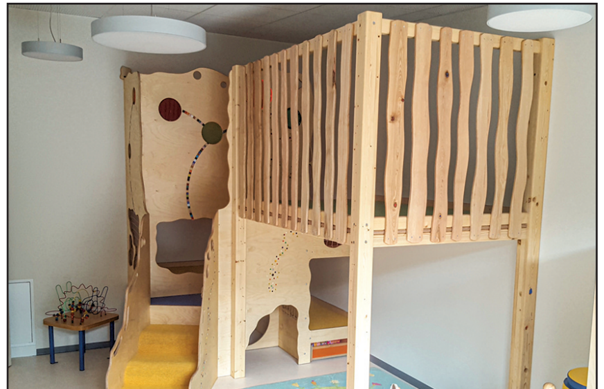
Schlaf- und Spielraum

Die Umbauarbeiten für den Altbau sind ausgeschrieben und werden in Kürze beginnen. Läuft mit den Handwerkern alles einigermaßen zeitgerecht, kann der gesamte Kindergartenbau Anfang des Jahres 2021 abgeschlossen sein. Dann stehen 5 Gruppenräume, darunter 2 Räume für Kinder unter 3 Jahren, für insgesamt 90 Kinder zur Verfügung. Damit erfüllt dann die Gemeinde die geforderten Kindergartenplätze für die nächsten Jahre. Waldmohr bietet damit für junge Eltern eine hervorragende Infrastruktur.