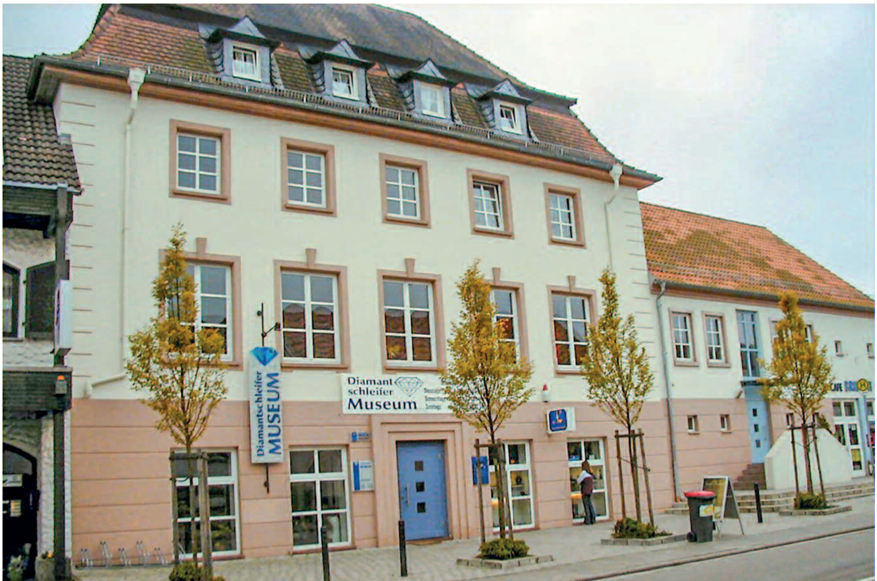
Das Diamantschleifer-Museum Brücken, Hauptstraße 47, ist dienstags von 9.30 Uhr-12 Uhr, donnerstags und sonntags von 14-17 Uhr geöffnet. Schleifervorführung und Besuche an Sonn- und Feiertagen sind nur nach vorheriger Anmeldung unter Tel. Nr.: 06386-9933168 möglich. www.diamantschleifermuseum.de

Weitere Informationen zum Diamantschleifer-Weg erhalten Sie im Tourismusbüro der Verbandsgemeinde Oberes Glantal, Rathausstraße 8, Schönenberg-Kübelberg, sowie in allen Bürgerbüros der Verbandsgemeindeverwaltung und bei der Tourist-Information Pfälzer Bergland „hin und weg“, Bahnhofstraße 67, Kusel.