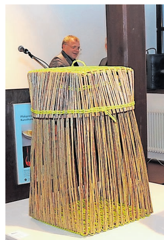
Kreative Objekte: Blick in die Ausstellung zum Pfalzpreis für das Kunsthandwerk 2017.

Kaiserslautern. Der Bezirksverband Pfalz lobt in Kooperation mit der Handwerkskammer der Pfalz den Pfalzpreis für das Kunsthandwerk aus. Der Preis wird als Hauptpreis und Nachwuchspreis (bis 35 Jahre) sowie in Form einer Anerkennung für Schüler vergeben und ist mit 10.000, 2.500 beziehungsweise 500 Euro dotiert. Um den Preis beziehungsweise die Anerkennung kann man sich selbst bewerben oder vorgeschlagen werden; dabei sollte ein sachlicher oder persönlicher Bezug zur Pfalz bestehen. Über die Vergabe der Preise entscheidet eine mit Fachleuten besetzte achtköpfige Jury. Sie kann jeweils für den Haupt- und Nachwuchspreis bis zu fünf Nominierte benennen; diese erhalten eine Prämie von 500 beziehungsweise 200 Euro. Die Preisgerichtsmitglieder können zudem entscheiden, einen Lebenswerkpreis zu vergeben, der nicht dotiert ist. Weitere Informationen, darunter die Richtlinien zu den Pfalzpreisen und der Ausschreibungstext sowie ein Anmeldeformular, finden sich im Internet unter www.pfalzpreise.de .