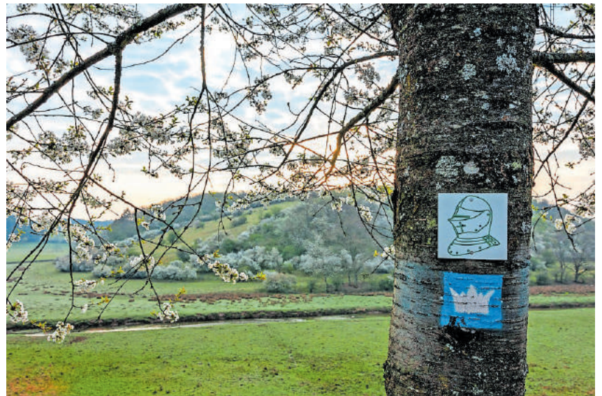
Der Ritter Gerin zeigt Ihnen als Markierungszeichen den Weg

Weitere Informationen zum Ritter-Gerin-Weg erhalten Sie im Tourismusbüro der Verbandsgemeinde Oberes Glantal, Rathausstraße 8, Schönenberg-Kübelberg, sowie in allen Bürgerbüros der Verbandsgemeindeverwaltung und auf der Homepage der Verbandsgemeinde Oberes Glantal unter www.vgog.de . Beachten Sie bitte bei Ihrer Wanderung die aktuell geltenden Corona-Regeln.