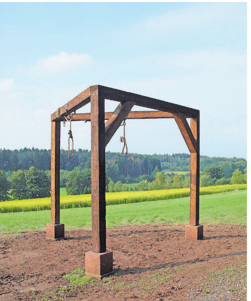
Galgen bei Sand