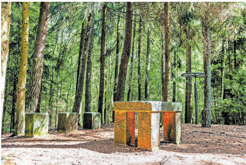
Rabentisch bei Schönenberg