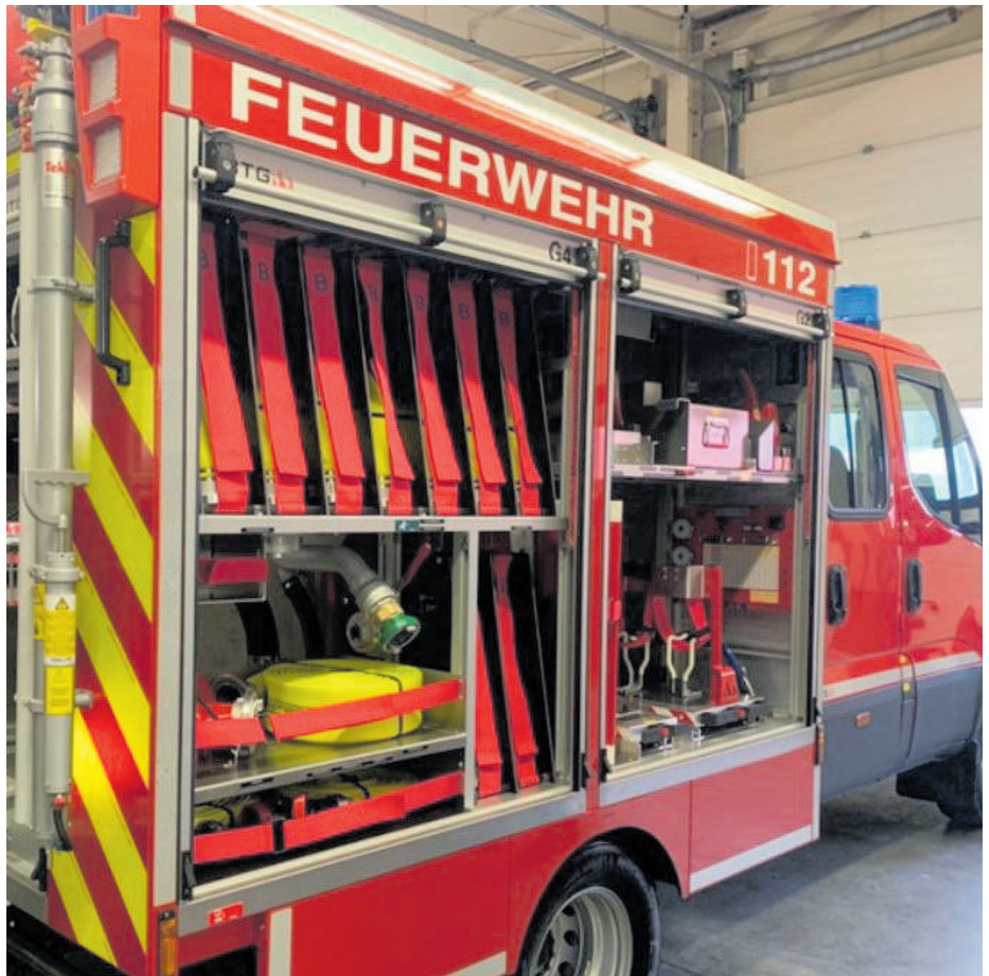
Beispielfoto KLF FF Hüffler/Quirnbach

Die Bauzeit beträgt ab Auftragsvergabe 18 Monate. Die Lieferung erfolgt bis spätestens 31.12.2022