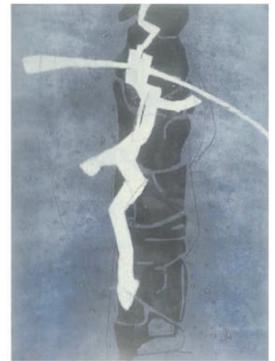
Adelheid Mosele Wegzeichen Holzschnitt 2016 50 x 70 cm

LANDSCHAFT & STILLLEBEN MALEREI / COLLAGEN / GRAFIK