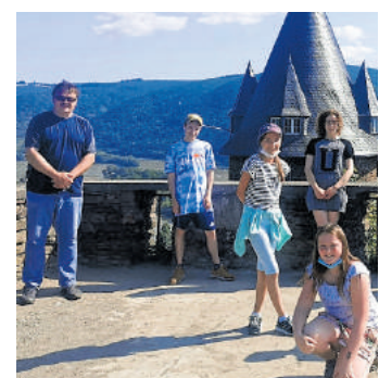
Auf dem Vorplateau der Burganlage mit Blick über das Weltkulturerbe Mittelrheintal. Im Hintergrund der große Bergfried der Burg.

Alles in allem war es eine interessante Freizeit, die allen Teilnehmern noch lange positiv in Erinnerung bleiben wird - eine Freizeit mit wichtigen Erlebnissen in der Gruppe sowie elementaren Erfahrungen in der Natur.