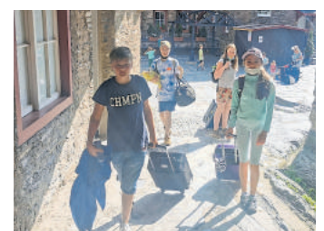
Leider hat alles ein Ende. Beim Verlassen des Burghofes - kurz vor unserer Rückfahrt.