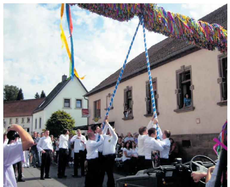
Brigger Kerb 2019 Umzug - Auto