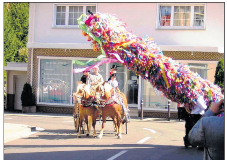
Brigger Kerb 2015. Umzug Kutsche