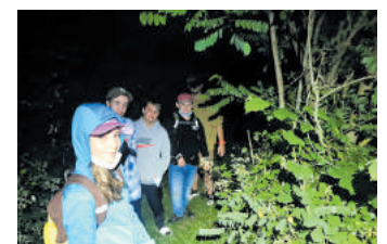
Die Nachtwanderung ist immer eine besonderer Höhepunkt unserer Erlebnisfreizeiten