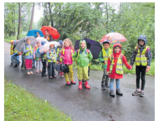
Auf dem Weg zum Eichelscheiderhof