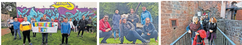
Foto1: Bereits schon ein Klassiker: Unsere „Outdoor-Aktion-Übernachtungsparty.“ Foto2: Besuch des Westwallmuseums mit interessanten Informationen, Gesprächen und Reflektionen Foto3: Trekking-Tour rund um die Saarschleife mit Besuch der Burg Montclair.

Auch in diesem Jahr konnte das Jugendhaus Waldmohr wieder ein auf alle Altersklassen zugeschnittenes Herbstferienprogramm mit verschiedenen inhaltlichen Schwerpunkten anbieten. Von erlebnispädagogischen Veranstaltungen wie Rad- oder Trekkingtouren bis hin zu Erlebnisfreizeiten mit Übernachtung gab es auch dieses Jahr wieder ein spannendes, interessantes und abwechslungsreiches Angebot. Großer Beliebtheit erfreuten sich Veranstaltungen mit Übernachtungen im Jugendhaus wie die „Outdoor-Aktion-Übernachtungsparty“ für die jüngeren Teilnehmer und Teilnehmerinnen. Aber auch Exkursionen mit informativen, gesellschaftlichen und historischen inhaltlichen Schwerpunkten, wie der Besuch der Tierauffangstation in Maßweiler, sowie die Radtour zum Westwallmuseum in Niedersimten, standen dieses Jahr mit auf der Angebotsliste. Auch möchten wir hier die Gelegenheit nutzen und einen besonderen Dank an unsere ehrenamtlichen Helfer richten, die unser Herbstferienprogramm 2021 tatkräftig mit unterstützt haben.