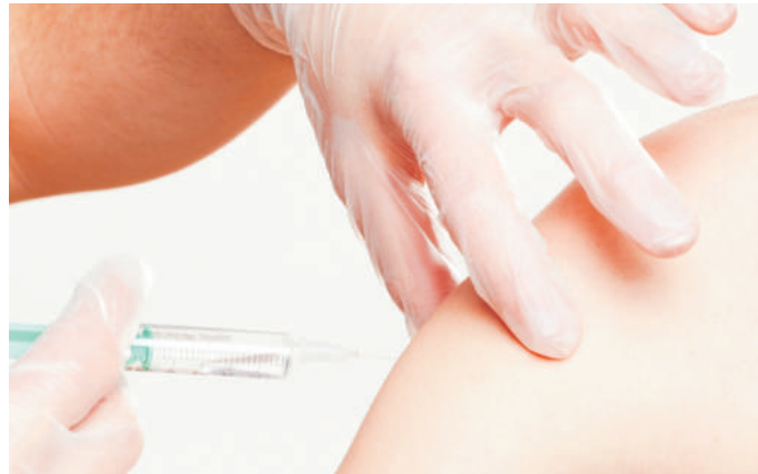
Seit Anfang August sind die Impfbusse in Rheinland-Pfalz im Einsatz

Wir haben zusätzlich zum Angebot der niedergelassenen Ärztinnen und Ärzte die Impfkampagne weiter verstärkt. Ab der kommenden Woche ergänzen acht reaktivierte Standby-Impfzentren und 21 Impfstellen an Krankenhausstandorten das Impfangebot in Rheinland-Pfalz. Die Impfbusse sind weiterhin flächendeckend, wohnortnah und niedrigschwellig im Einsatz. Die Anzahl der Busse wurde bereits auf acht erhöht, weitere kommen dazu“, so Landesimpfkoordinator