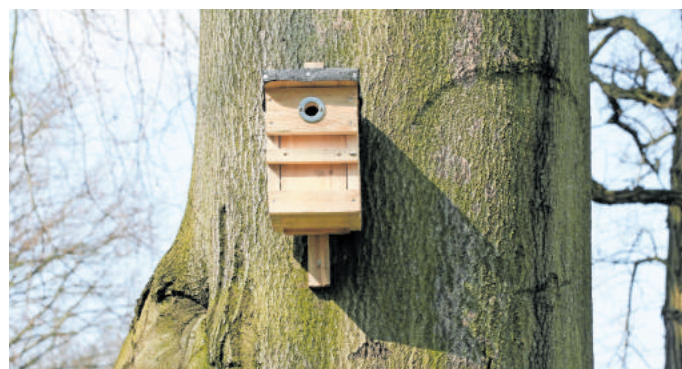
Nistkästen können verschiedensten Tieren im Garten als Winterquartier dienen

Aber nicht nur Vögel suchen im Winter Schutz in künstlichen